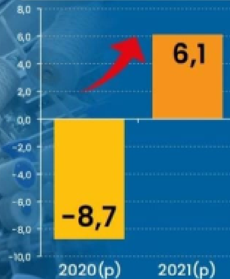
Crecimiento del PIB 2020 - 2021 (En porcentaje)

(p) Preliminar Fuente: Instituto Nacional de Estadística (INE) Elaboración: Ministerio de Economía y Finanzas Públicas, Unidad de Análisis y Estudios Fiscales