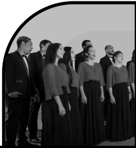
Coro Nacional de Cuba