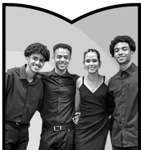
Conjunto de Flautas Op. 5