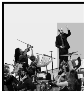
Orquesta del Lyceum de La Habana