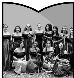
Orquesta de Cámara de La Habana

el 2016, durante la visita a Cuba del Comité de las Artes y las Humanidades del presidente Barack Obama, la orquesta tuvo el privilegio de trabajar con el violinista estadounidense Joshua Bell en su visita a Cuba. Esta colaboración le valió la invitación a un concierto titulado Seasons of Cuba en la Rose Hall del Jazz del Lincoln Center de Nueva York. El mismo fue filmado y transmitido por la Public Broadcasting Service (PBS) como parte de sus programas Live at Lincoln Center y resultó nominado a los Premios Emmy 2017.