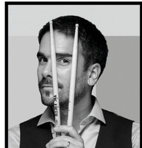
Ruy Adrián López-Nussa

en los festivales de jazz más renombrados de los Estados Unidos. Además de su éxito como intérprete, ha incursionado en el mundo del cine. Junto a Harold López-Nussa creó la música de: El Camino de las Gaviotas , animados producidos por Cuba y Brasil, Fábula (2011), película cubana dirigida por Lester Hamlet, El tren de la línea norte (2014), documental cubano dirigido por Marcelo Martín y El último balseiro (2019), cortometraje de Oscar Ernesto Ortega y Carlos Rafael Betancourt.