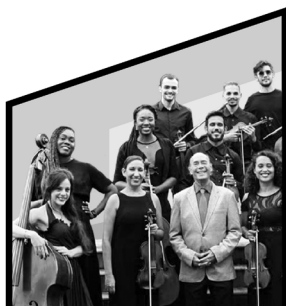
Orquesta de Cámara Música Eterna